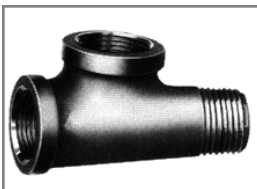
BIMST/GIMST Reducer Series