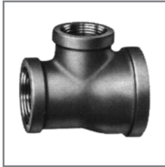
BIMT/GIMT Reducer Series