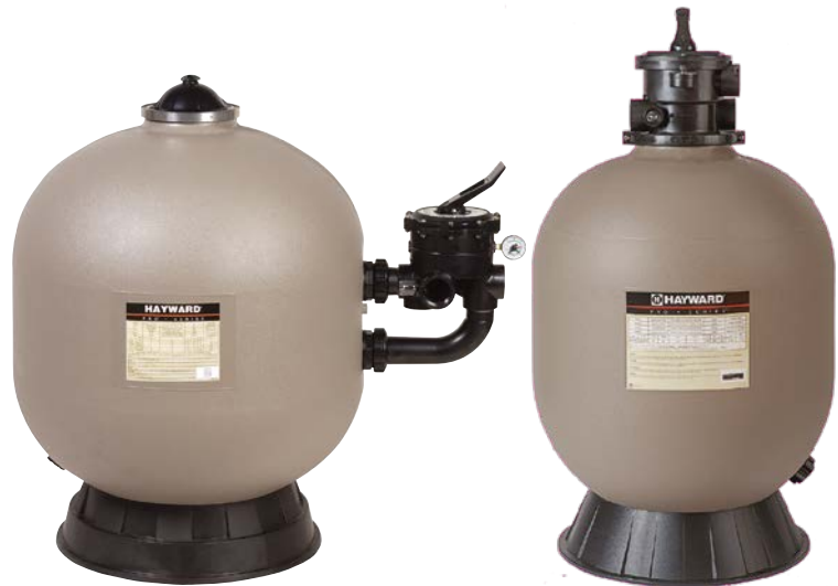
ProSeries™ HB Side