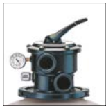
Sable facilement accessible grâce au collier de démontage