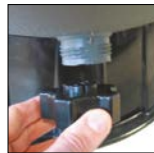
Drain avec son bouchon de grande dimension servant d'outil de démontage