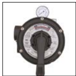
Vanne Vari-Flo™ 6 positions