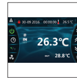
Nouvelle interface utilisateur, intuitive et très informative