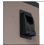
Raccordement électrique simplifié