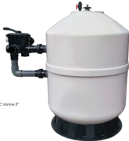
1050C Vanne 3"