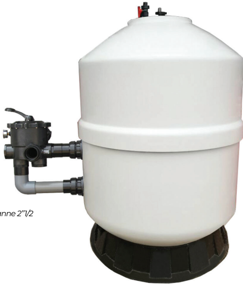
1050C Vanne 2"1/2